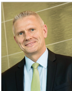
Marc Springstein © BEDRA

„Auch im Schmuck bauen wir wieder auf langfristige Werthaltigkeit unseres Angebotes mit klassischen und zeitlosen Schmuckstücken beim Basis- und Diamantschmucksortiment sowie bei Ketten. Der 80 qm-BEDRA-Stand war an allen Messetagen sehr gut besucht und das Angebot wurde über die Erwartungen hinaus genutzt.“ Durch den Verzicht auf die Trendkollektionen möchte die BEDRA Aufwendungen für Lagerbestände und Ressourcen optimieren. Diese Produktstrategie soll letztendlich die „sehr guten Konditionen sichern“, die BEDRA an ihre Kunden weitergibt. Anlässlich des Prozessendes teilt man uns außerdem aus Weil der Stadt mit: „Alle BEDRA-Kunden dürfen sich mitfreuen.“ Denn: Das Unternehmen bedankt sich bei allen, die der BEDRA die Treue gehalten haben mit einer lohnenswerten Promotion-Aktion. Man dürfe gespannt sein.