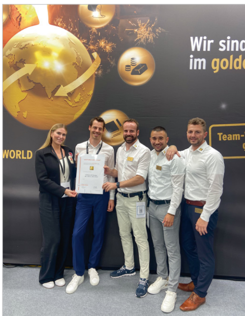
Urkundenübergabe mit dem BEDRA-Team

Burger Edelmetalle zu Ihren drei besten Edelmetallpartnern 2022/2023 zählen. Aufgrund des knappen Ergebnisses wollen wir Ihnen die Namen der Unternehmen, die das Siebertreppchen nur ganz knapp verpasst haben, nicht vorenthalten: Den vierten Platz teilen sich Heimerle & Meule und Agosi . Wir gratulieren den Bestplatzierten, die nach wie vor das Vertrauen ihrer Juwelier-Partner gewinnen konnten!