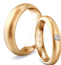
Jetzt NEU: Trauring-Konfigurator mit unzähligen Möglichkeiten.

Eine weitere spannende Neuheit ist MANÓRA – das erweiterte Schaufenster für Juweliere. Es unterstützt den Fachhandel, um mehr Umsatz und deutlich mehr Kundenfrequenz in das Ladengeschäft zu bringen. Die Plattform soll es den Händlern ermöglichen, mit minimalem Aufwand ihr Schaufenster in die digitale Welt zu erweitern und Produkte zu verkaufen, die sie selbst nicht einmal lagernd haben – ohne finanzielle Risiken.